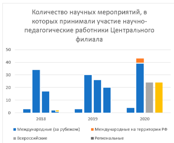
Рис 2. Динамика участия преподавателей в научных мероприятиях