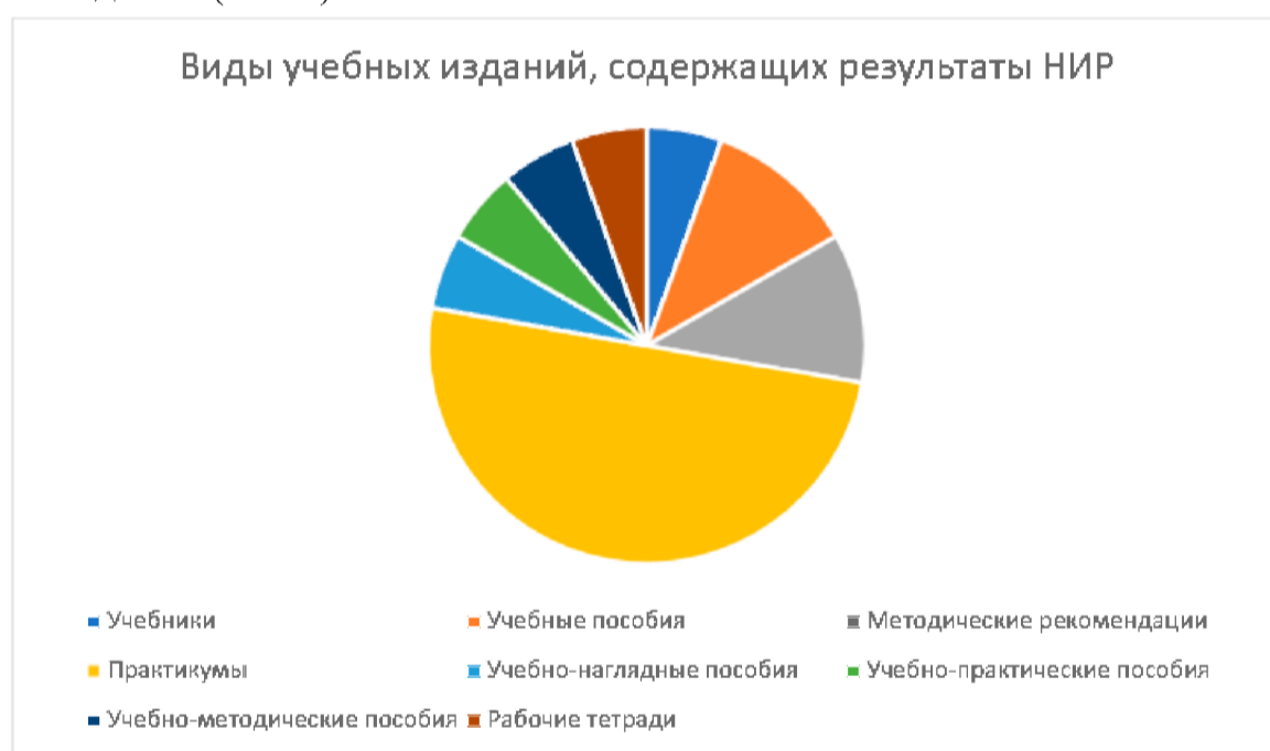
Рис. 3. Соотношение видов учебных изданий, содержащих результаты НИР

Результаты НИР, полученные в 2020 г., внедрялись в учебный процесс при реализации образовательных программ по специальностям и направлениям среднего профессионального и высшего образования и были использованы при подготовке учебных изданий (Рис 3).